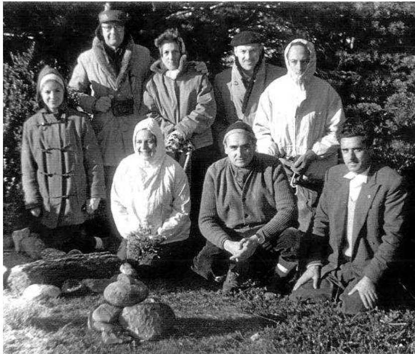
Imagen de la primera celebración del Belén montañero, el año 1962, en la Peña del Sol (Riglos).

Velilla de Ebro está situada al sureste de Zaragoza, a 52 km de la