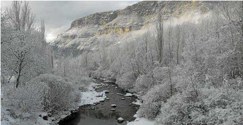
'Ésera nevado antes de Ventamillo', de Jose M a Cereza, tercer premio.

Desde hace ya muchos años la imagen fotográfica y el entorno natural se han convertido en compañeros inseparables. Hoy en día, esta relación se ha incrementado gracias al desarrollo de procesos digitales.