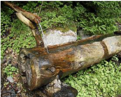
'Agua fresca', de Eva González, tuvo el primer accésit.