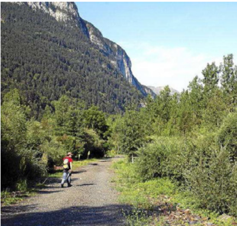
Pista junto al río Cinqueta a la salida de la localidad de Plan.