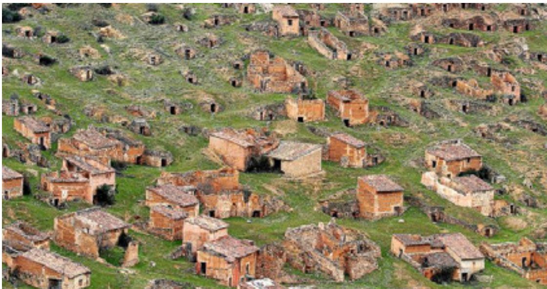
Cuevas y bodegas tradicionales en la localidad de Torrijo de la Cañada, punto de partida de la ruta.

Entre Torrelapaja y Ateca, el sendero de pequeño recorrido PR-Z 95 desarrolla cinco tramos que descubren al caminante los inmensos atractivos del valle del río Manubles. Para esta escapada senderista otoñal, se describe uno de sus tramos centrales, concretamente el tercero, con el interés añadido de visitar el rico patrimonio de las localidades de Torrijo de la Cañada, Villalengua y Moros.