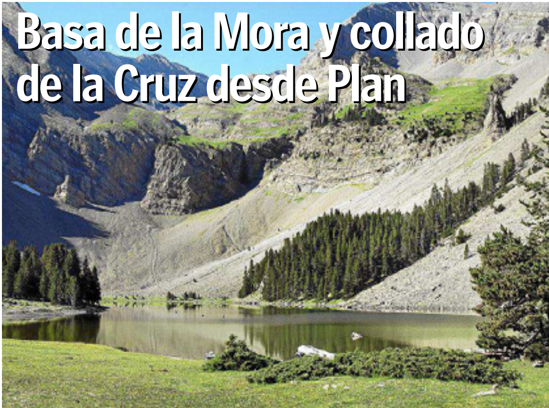
Paisaje del ibón de la Basa de la Mora, uno de los lugares más emblemáticos de esta travesía de montaña.

TRAVESÍA | Por geografías montañosas, cubiertas por un manto de pino negro, y un mundo de rocas y hielo