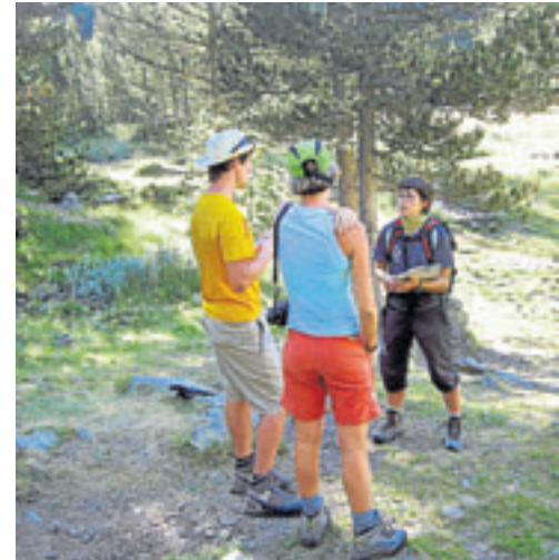
Entorno de los ibones de Batisielles. MONTAÑAS SEGURAS