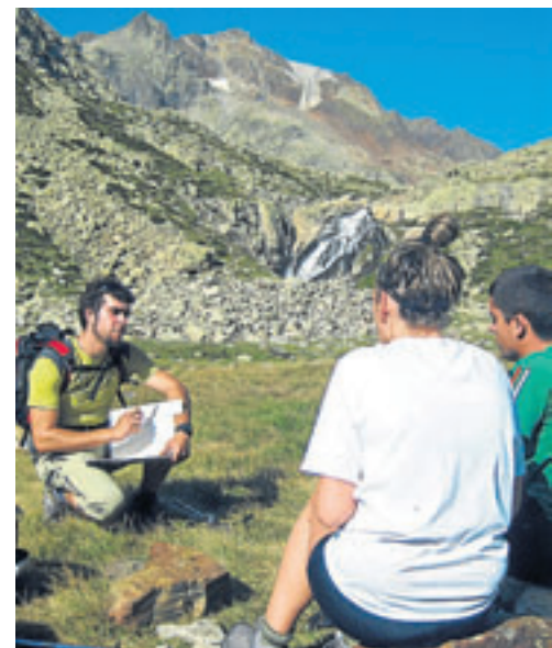
Ruta a los ibones Azules, valle de Tena. MONTAÑAS SEGURAS