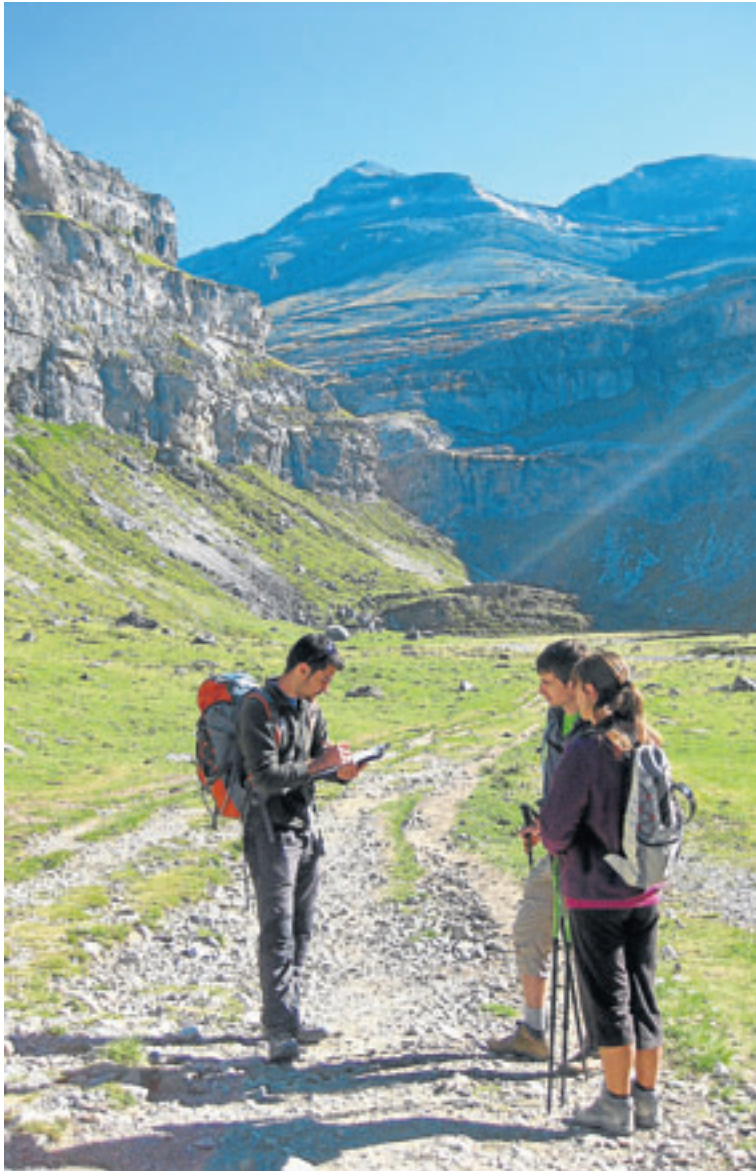
Excursión a la Cola de Caballo, en el valle de Ordesa. MONTAÑAS SEGURAS

La naturaleza de la campaña exige una renovación constante para incrementar el cumplimiento de los objetivos básicos de informar, asesorar y sensibilizar al excursionista sobre la seguridad en la montaña.