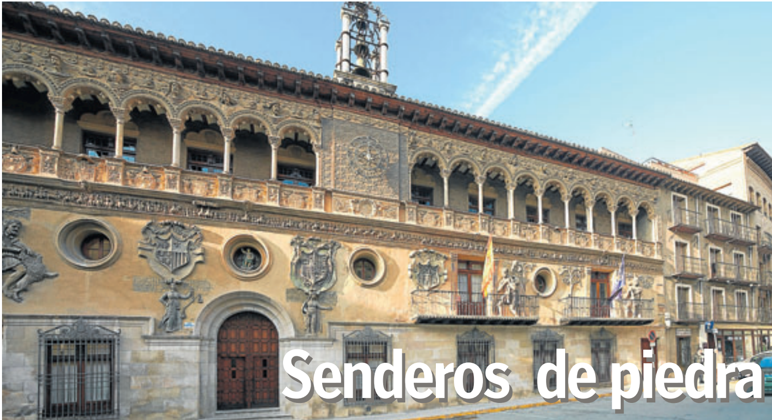
Plaza de España de Tarazona, donde se ubica el renombrado Ayuntamiento.

ESCAPADA | Una ruta urbana muy completa para conocer los enormes atractivos de Tarazona