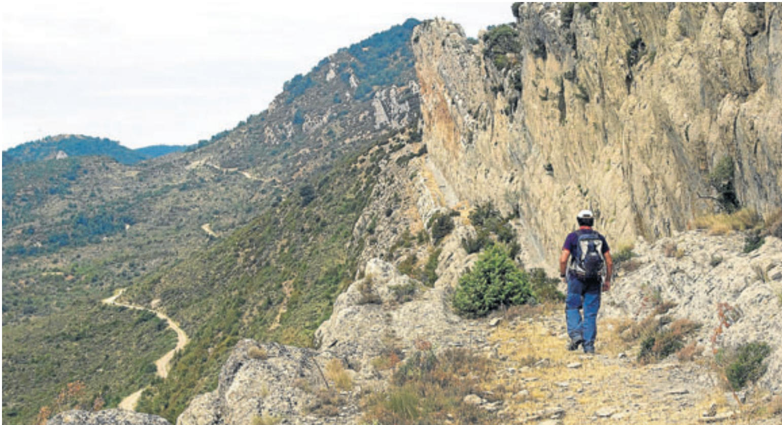
Una de las rutas propuestas transita por el paso de La Osqueta.

H ace ya más de cuatro años que Turismo de Aragón realizó un apuesta decidida para promocionar la práctica del senderismo y la bicicleta de montaña por nuestra Comunidad autónoma. El objetivo prioritario de la iniciativa no podía ser otro que el de ayudar a la ciudadanía a conocer Aragón a través de sus caminos. Son rutas que, en definitiva, invitan a vivir la experiencia del territorio, con especial mención para el medio natural; pero sin descuidar, en ningún caso, la oferta patrimonial o los innumerables tesoros que guarda la geografía aragonesa.