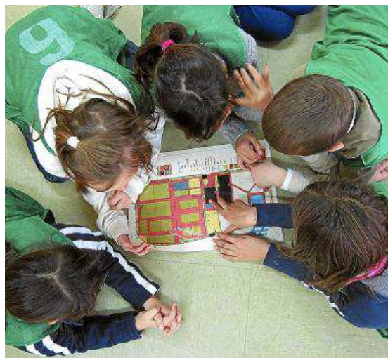
Un grupo de pequeños participantes aprendiendo a orientarse.

Aunque las actividades realizadas en el marco del programa CAI Montaña y Medio Ambiente han sido dirigidas a grupos de escolares, de 8 a 12 años de todo Aragón, también se hace partícipes a los docentes que acuden con sus alumnos y se les entrega material didáctico específico, que transmite los objetivos de la campaña.