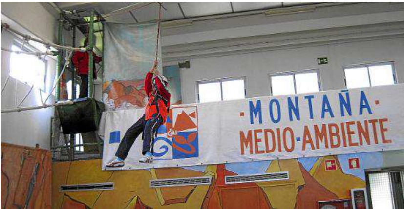
Completado el circuito, se desciende en tirolina.