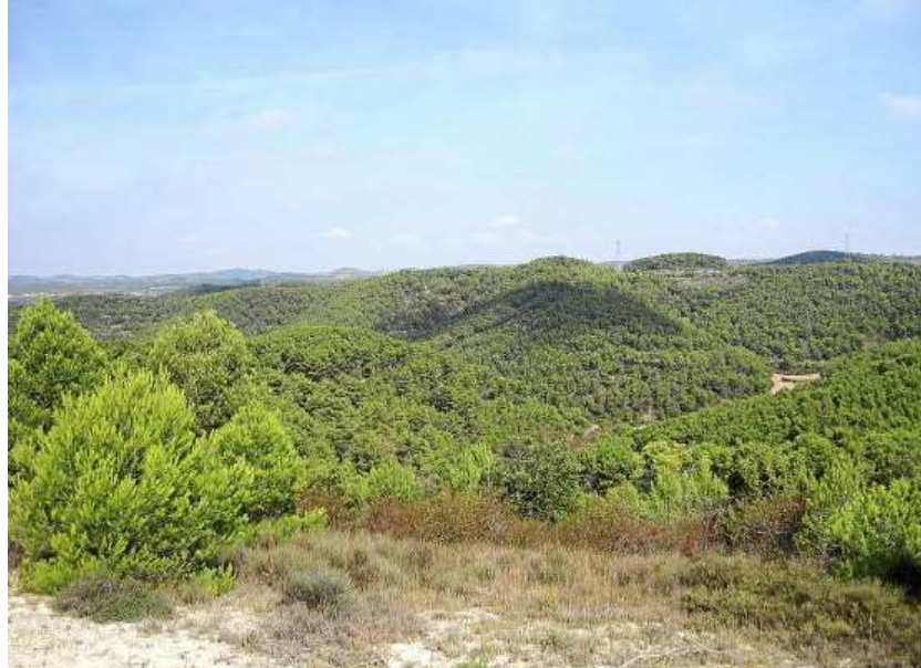
Panorámica de los montes de Castejón de Valdejasa desde la cabañera.

Medio kilómetro después se pasa junto a una señal que dirige hacia la derecha. Esa opción será la que se realice en la bajada, pero en este punto de la ruta se sigue por