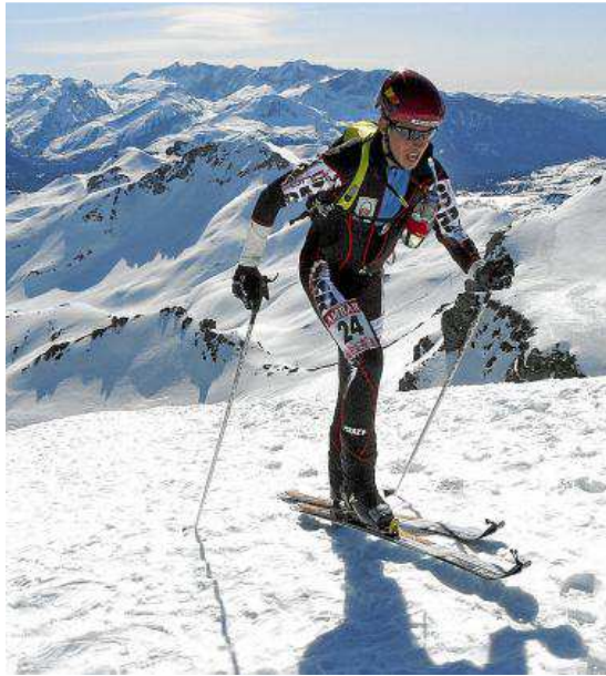
Competición de esquí de montaña.

Por tercer año consecutivo, desde la Federación Aragonesa de Montañismo (FAM) y sus clubes se apuesta por recuperar el sabor de encuentro que tenían las pri-