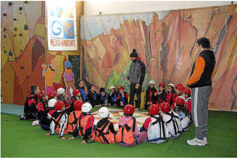
Trivial de montaña antes de comenzar el circuito.

Disfruta siempre de las excursiones que decidas realizar, pero no degrades nunca el medio. Cuida el entorno y respeta a las gentes del lugar y sus propiedades.