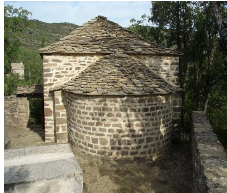
LA GUARGUERA SABIÑANIGO - HUESCA