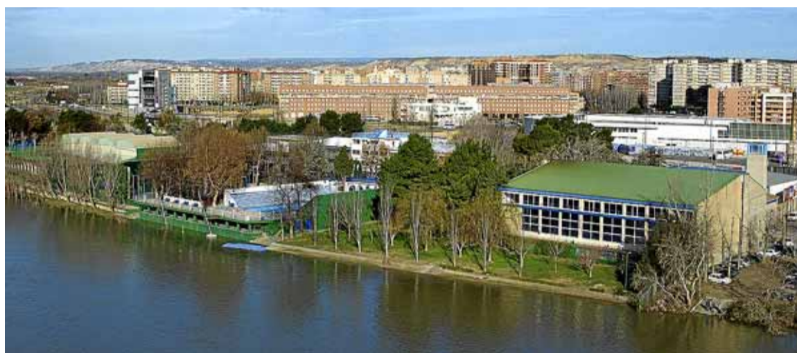
Instalaciones del C. N. Helios, junto al puente de Santiago, final del recorrido.

■ Inscripciones: en la Federación Aragonesa de Montañismo (C/ Albareda, 7, 4º, 4ª. Zaragoza), del 1 al 25 de julio, en horario de oficina. Para más información se puede consultar en el teléfono 976 227 971, a través de los correos electrónicos fam@fam.es y toulouse-zaragoza@fam.es y de la página web: www.fam.es.