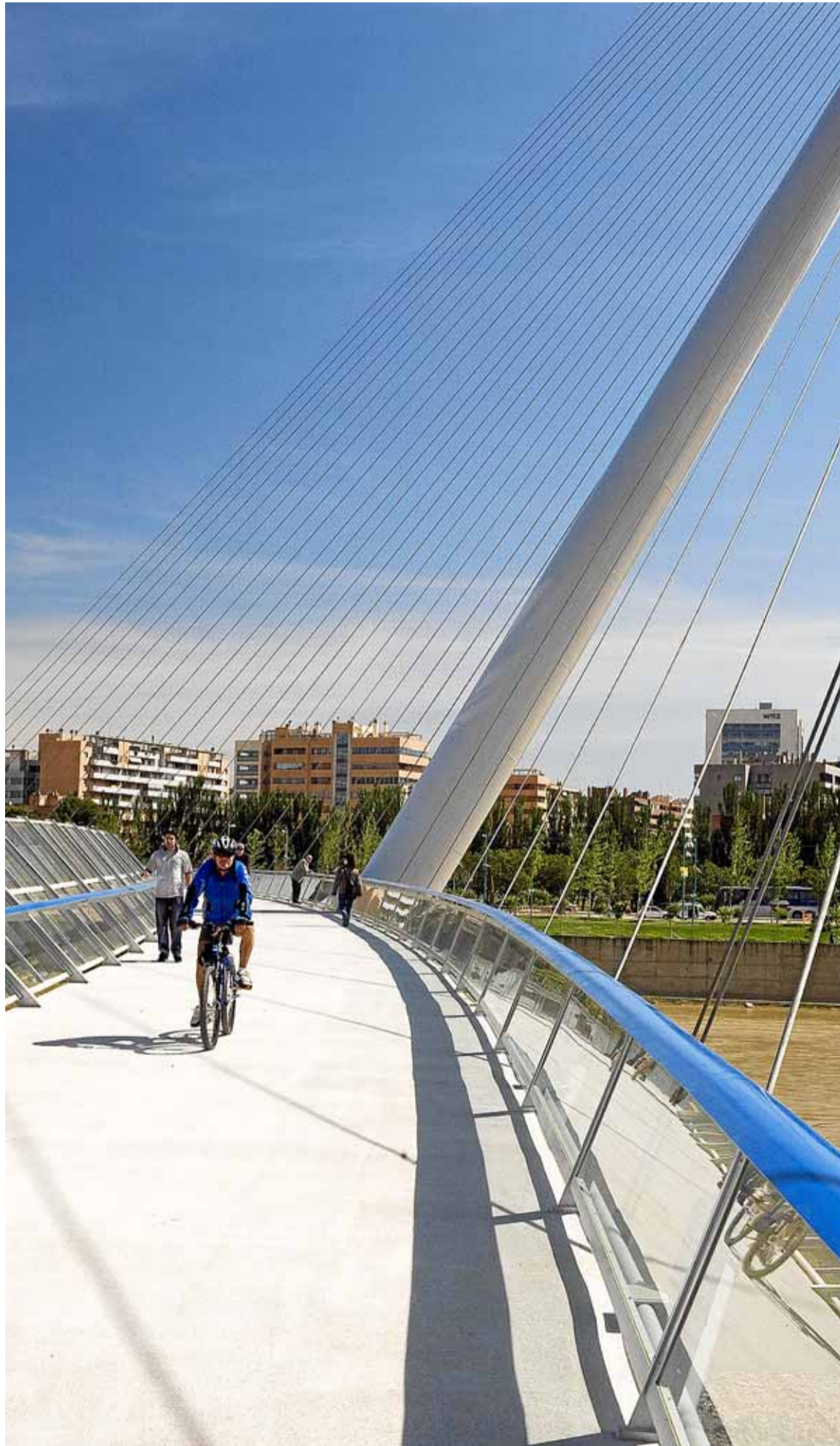
Pasarela del Voluntario o de Manterola.

7,30 horas: Zaragoza. Salida de los autobuses desde la plaza