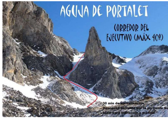
Imagen 2.- Localización del corredor del ejecutivo.