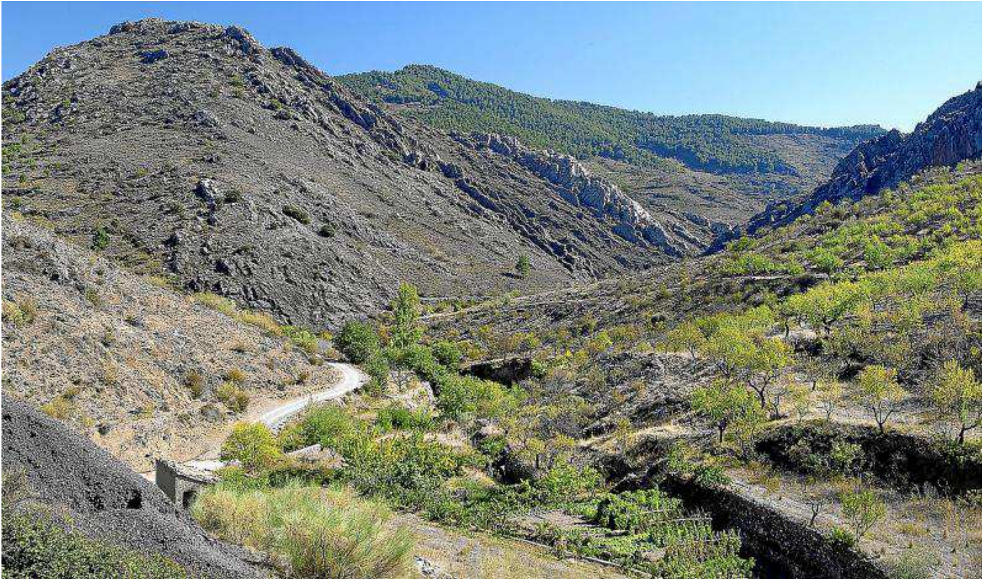
Vista panorámica del valle del río Tiernas desde la casa de las Minas de Plata, en el corazón de la sierra de Algairén.

E l pequeño río Tiernas discurre entre dos cordales montañosos por el corazón de la sierra de Algairén. A lo largo de su curso, y en su continuación por el río Alpartir, se observará una frondosa vegetación arbórea a base de fresnos, avellanos, acerollos, sauces y serbales. En sus vaguadas, la inversión térmica permite ver el rodal bajo del carrascal. Allí se encontrará roble albar, quejigo y otros robles híbridos de ambos, entre los que se intercalan arces de Montpellier y enebros. En el sustrato vegetal predominan las melíferas.