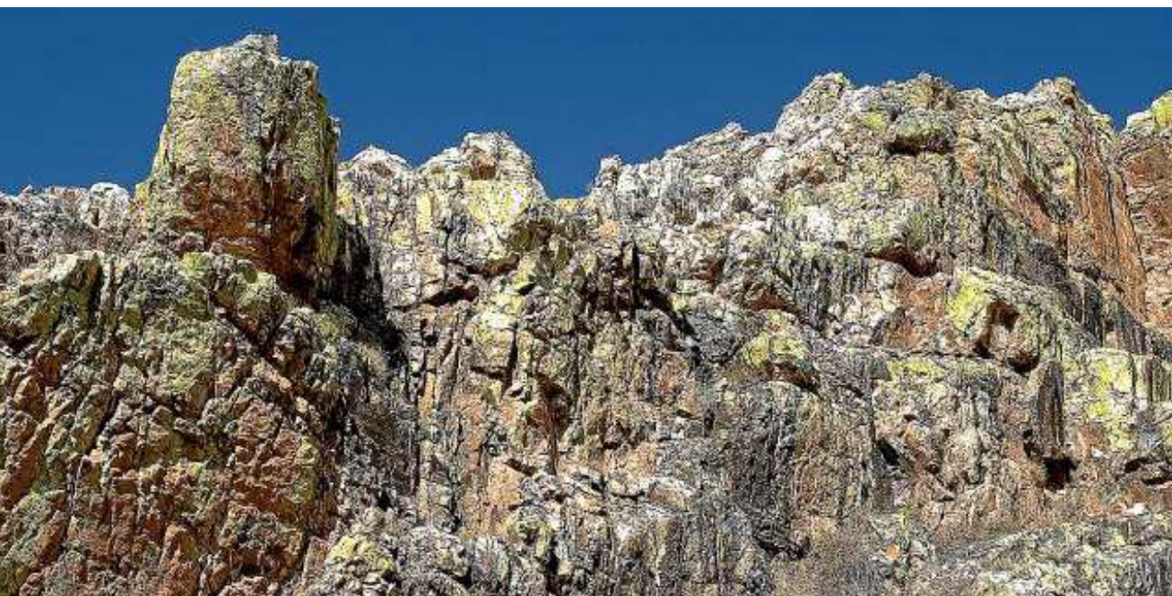
Montañas rocosas muy características del valle del Tiernas.

Aquí conviven las faldas y cimas de la sierra de Algairén con los meandros del Jalón. También destacan el entorno del santuario de Rodanas, el río Tiernas o las formaciones kársticas de Morata de Jalón.