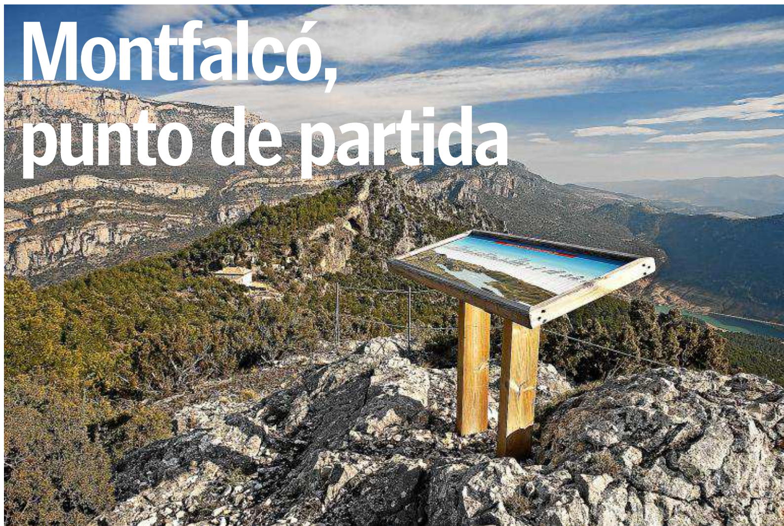
Vista del albergue Casa Batlle, desde el mirador de Montfalcó, donde se sitúa una mesa de interpretación del paisaje.

INFRAESTRUCTURAS | El albergue Casa Batlle se ubica en un emplazamiento senderista privilegiado