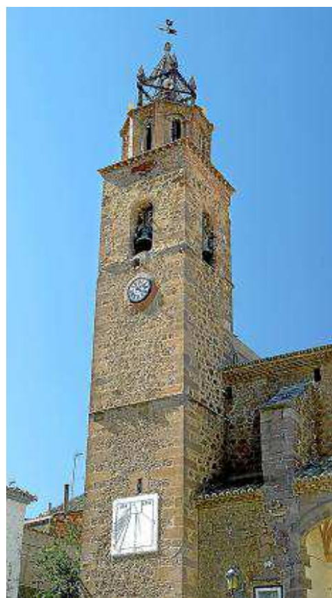
Nuestra Señora de los Ángeles. JAVIER ROMEO