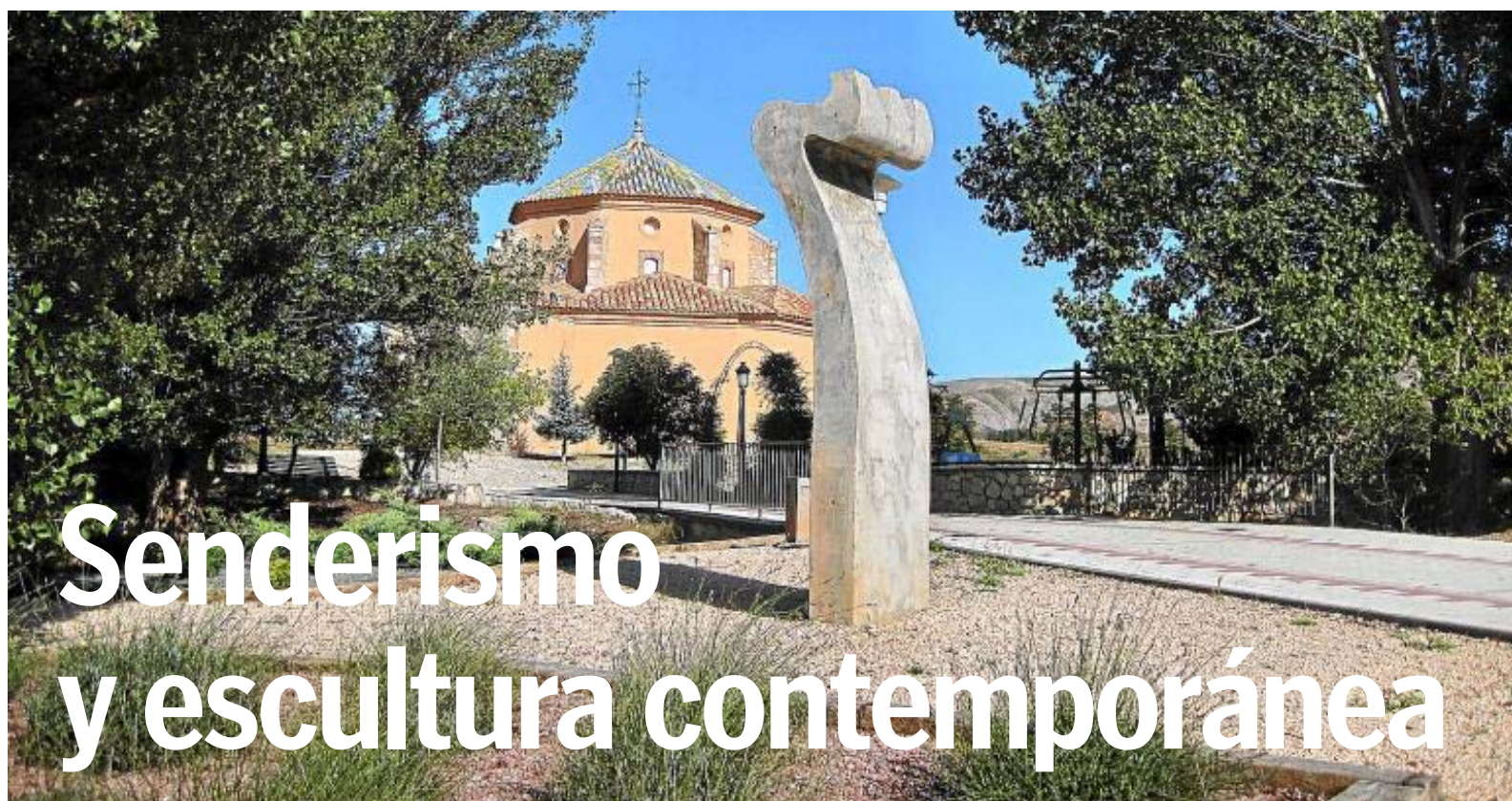
Escultura de Vicente Berna, 'La Huella', en Hinojosa de Jarque. Al fondo, la ermita del Pilar.

ESCAPADA | Caminando entre Hinojosa de Jarque y Cobatillas, un itinerario por el PR-TE 107