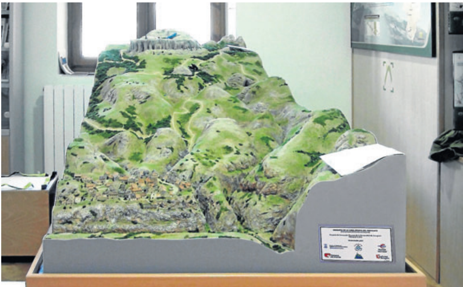
Maqueta del término de Purujosa hasta el Morrón del Moncayo, realizada para valorar supuestos de accidentes.

D e gran éxito puede calificarse el desarrollo del Módulo II del Máster de Medicina de Montaña y de la Extrema Periferia (Máster Mmep). Se ha realizado con el apoyo de la Consejería de Ordenación del Territorio del Gobierno de Aragón y la aplicación de un proyecto de innovación docente para la información, formación, prevención y asistencia de los accidentes en el medio natural y la montaña.