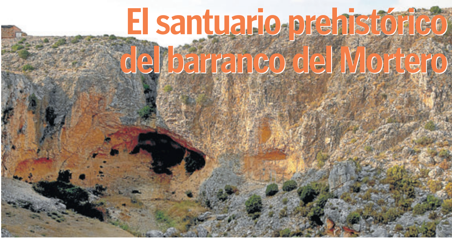
Vista parcial del barranco del Mortero, lugar por el que transcurre esta ruta, próximo al pueblo de Alacón.

La ruta comienza en pleno Parque Cultural del río Martín. Desde aquí, se describirá un recorrido por las bodegas de Alacón y por uno de los parajes más destacados del arte rupestre aragonés.