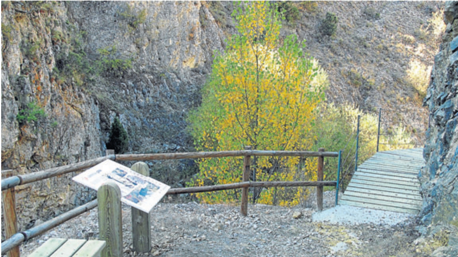
El entorno de la Poza es uno de los lugares más bellos y característicos de la ruta por el barranco de la Hoz.

P ara acceder hasta la gran llanura cerealista de la depresión del Jiloca, se toma la autovía mudéjar A-23, bien desde Zaragoza o desde Teruel. Se trata de un paraje formado por una enorme y amplia depresión, a unos 1.000 m de altitud, tapizada por los materiales detríticos transportados desde las sierras más elevadas.