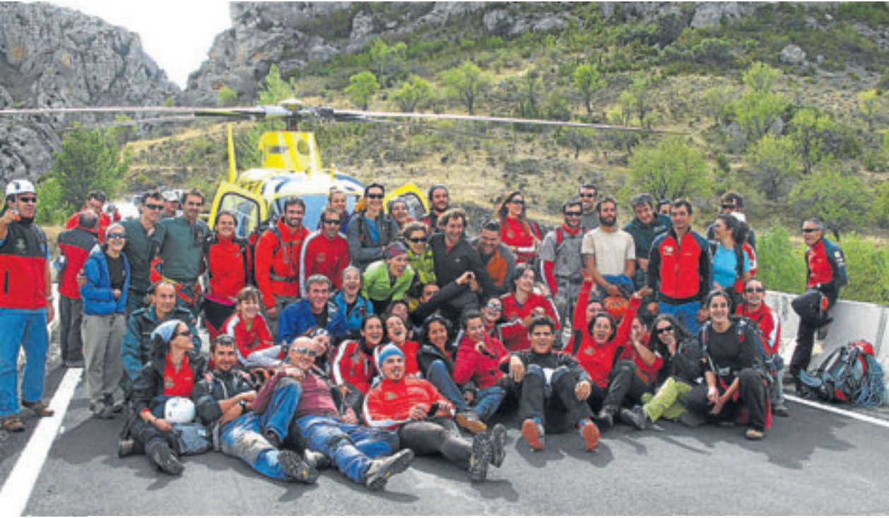
Grupo de participantes en el simulacro de evacuación con el helicóptero del 112-SOS Aragón. ENRIQUE RECIO

Entre sus finalidades básicas, esta disciplina formativa enseña una medicina de urgencia de máxima calidad en medios aislados, así como a saber llegar hasta el paciente con seguridad.