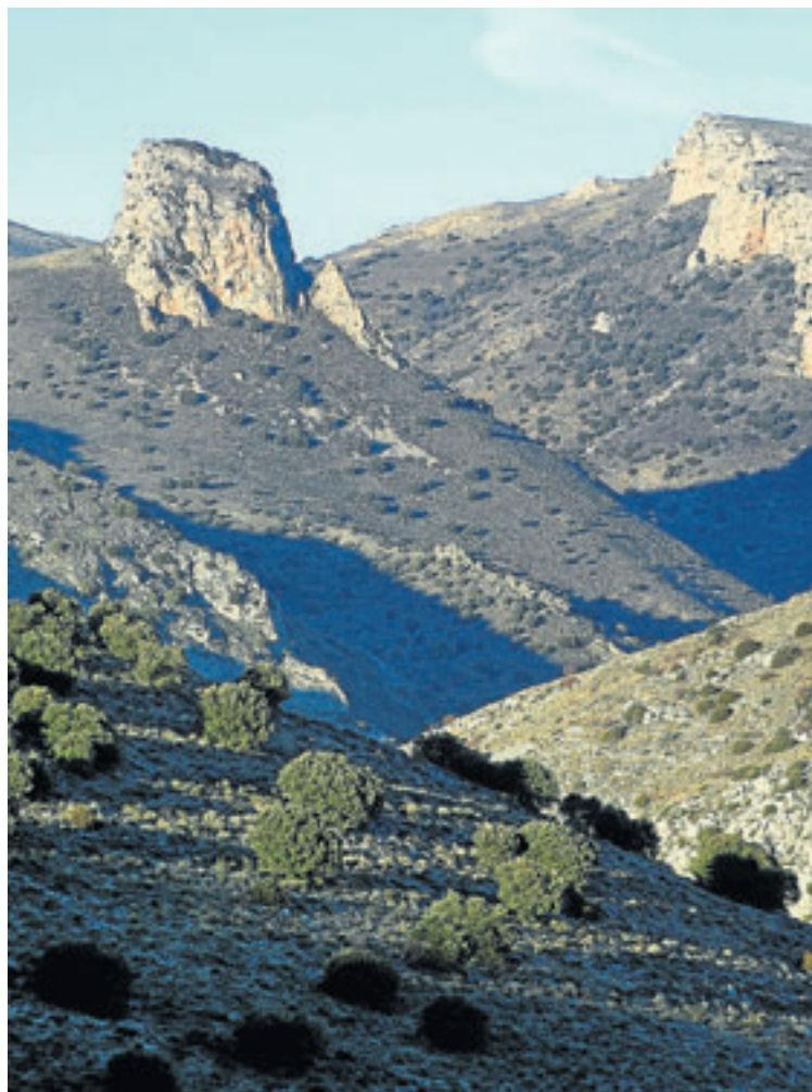
Barranco de Valcongosto, en Purujosa.

ASESOR DE LA FAM Y COORDINADOR DE LOS CUJUMJ