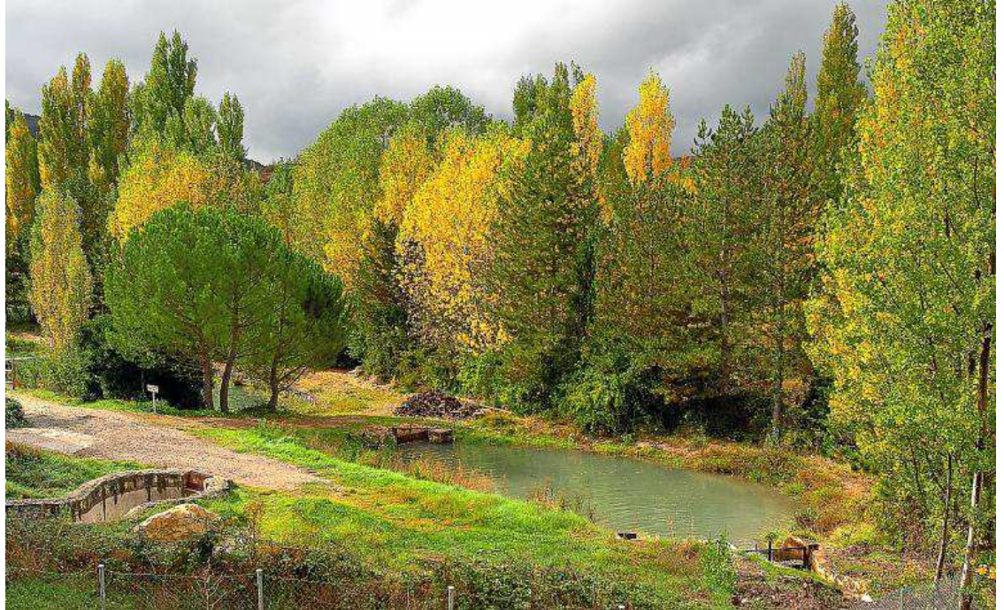
Piscifactoría en el río Arcos al paso del GR 10.

Desde el vértice geodésico se desciende hacia el repetidor, donde encontraremos las instalaciones del centro emisor de Javalam-