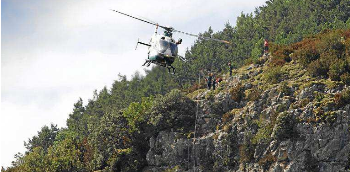
Exhibición de rescate durante el XIII Congreso de la SEMAM. FERNANDO RIVERO

Primero fueron los montañeses, luego, los montañeros o una espontánea amalgama de montañeses y montañeros. Así hasta que, a finales de los años 60 y principios de los 70 del siglo XX, Aragón, con el impulso de la Federación Aragonesa de Montañismo, basándose en la similitud con la Gendarmería francesa y en los acuerdos transfronterizos de ayuda mutua entre Francia y España, consiguió que la Guardia Civil asumiese al completo con sus Greim (inicialmente, Grupos Rurales de Intervención en Montaña), en cuyo nombre era importante destacar lo de 'rurales', el complejo y acuciante problema del rescate en montaña en Aragón, región donde se producían más del 60% de todos los rescates de montaña que se daban en España.