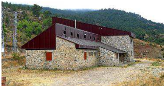
Refugio de Rabadá y Navarro. PRAMES