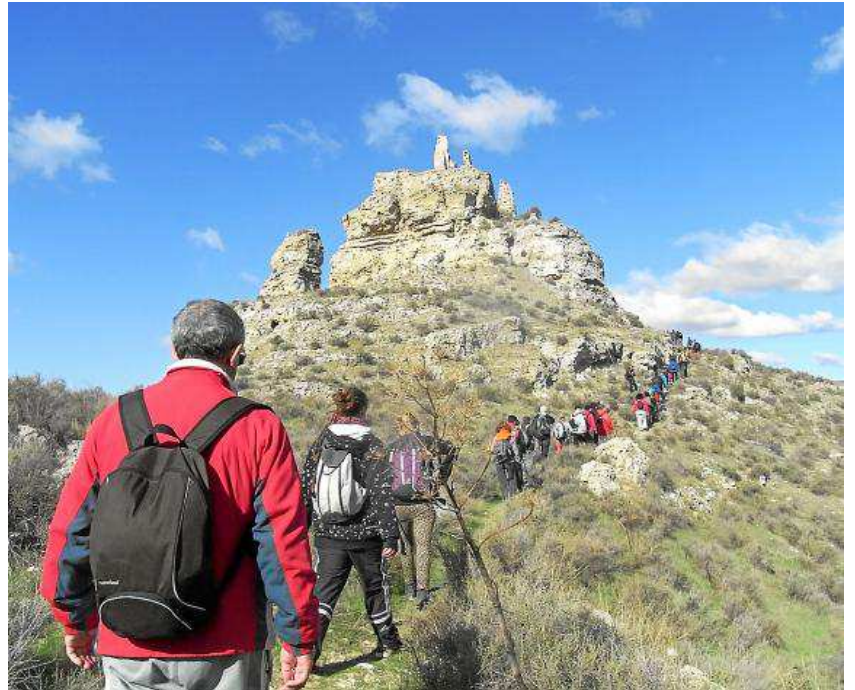
Marcha al castillo de doña Urraca durante el XIV Día del Senderista de Aragón. JOSÉ MARÍA GALLEGO

D esde el alto Pirineo hasta el bajo Teruel, recorriendo senderos y caminos, pasando por todas las comarcas, se ha desarrollado el calendario de las Andadas Populares de Aragón, coordinado por la Federación Aragonesa de Montañismo.