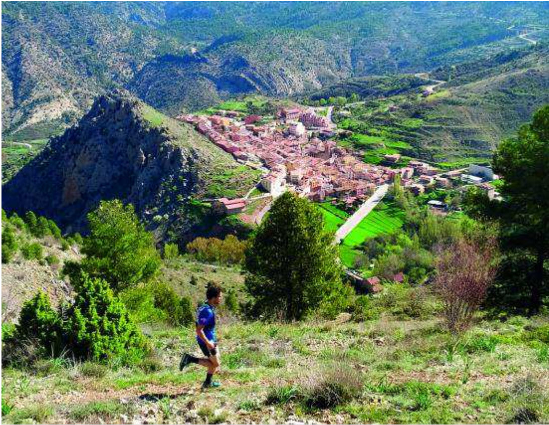
Las rutas del #desafiofam2021 incluyen opciones que discurren por senderos marcados como los Espacios Trail Montaña.