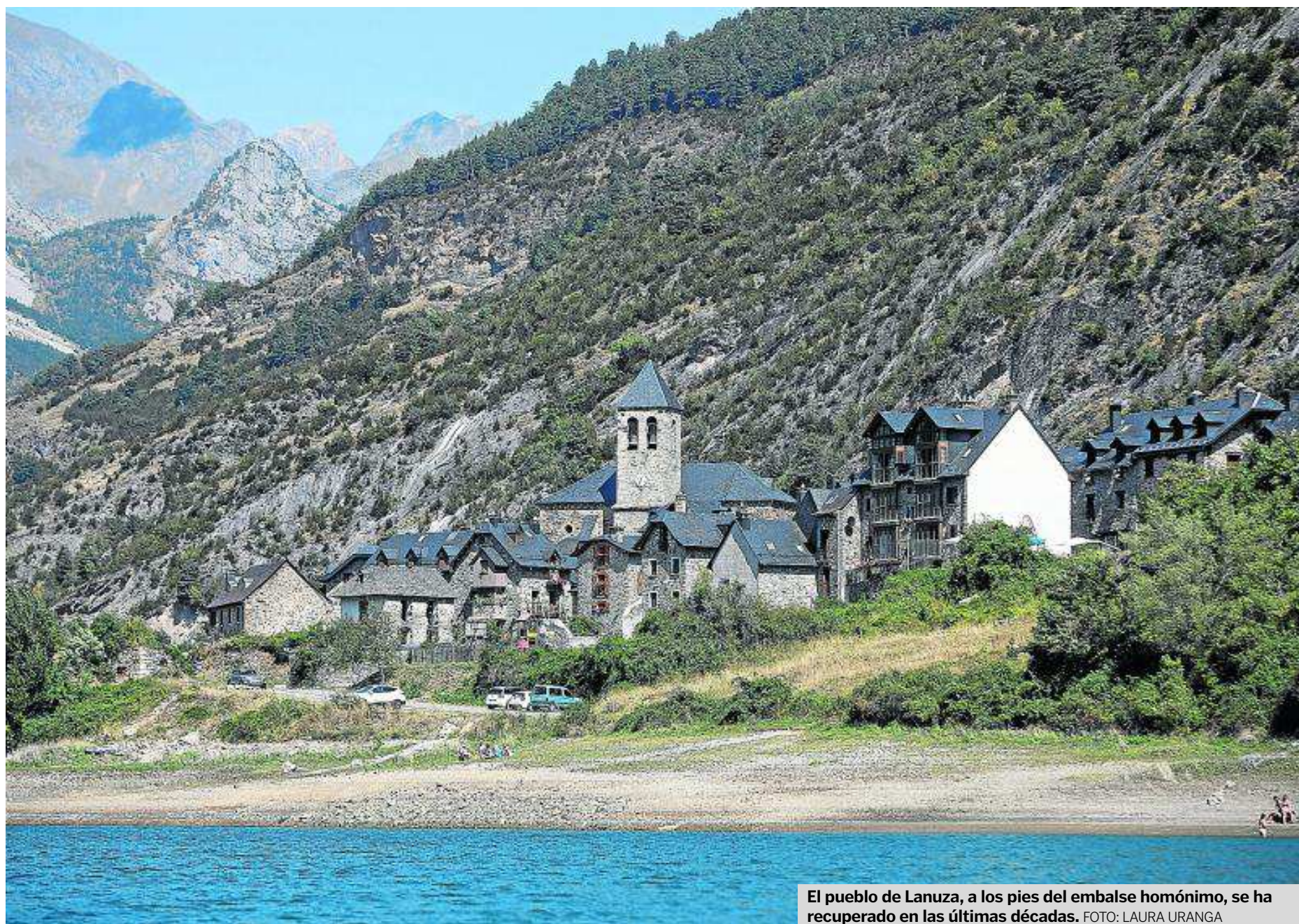
El pueblo de Lanuza, a los pies del embalse homónimo, se ha recuperado en las últimas décadas.