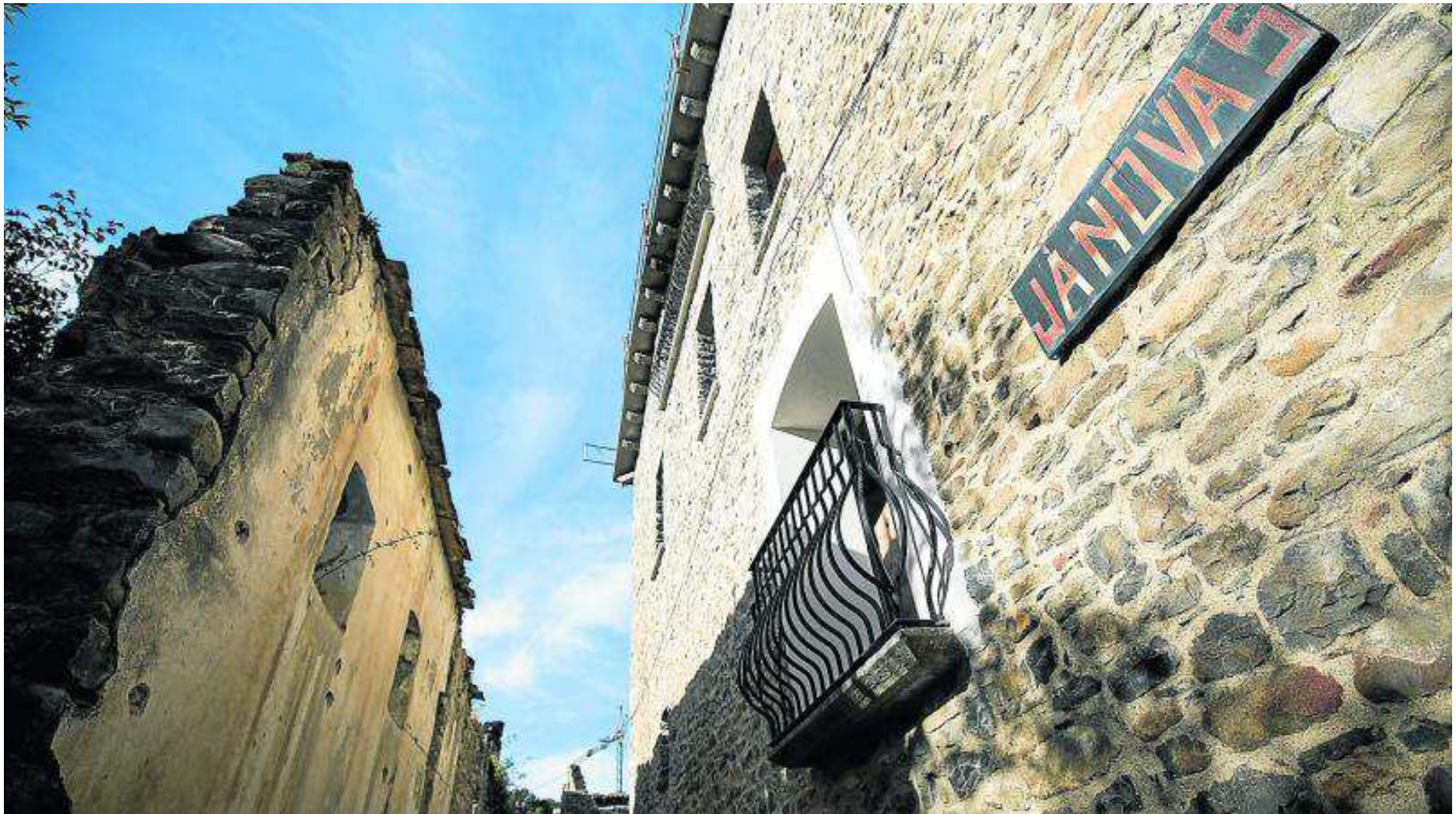
La localidad de Jánovas es uno de los ejemplos de pueblo abandonado –y recuperado– en la provincia oscense. LAURA URANGA