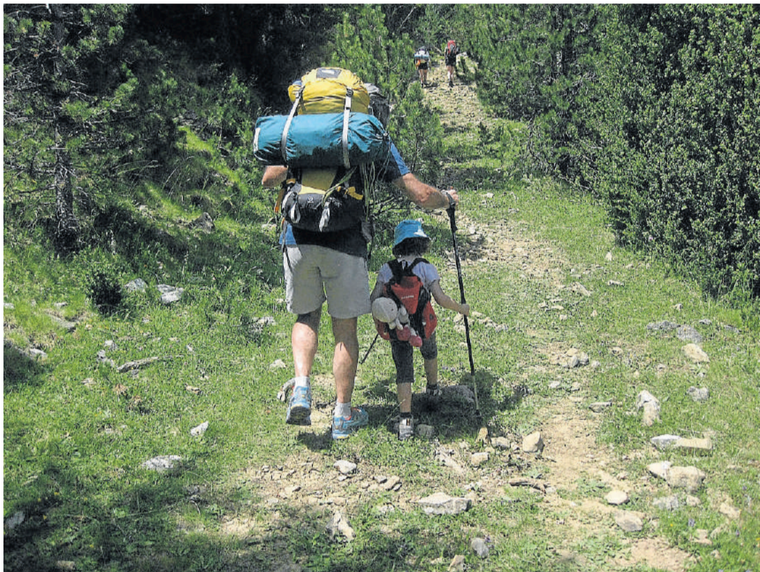
La campaña Refufamily propone rutas seleccionadas para ir con niños desde los refugios aragoneses con acceso en vehículo y un concurso infantil de dibujo. MONTAÑA SEGURA

La cuarta edición de Refufamily vuelve a ofrecer sus recursos para emprender las primeras rutas con los más pequeños