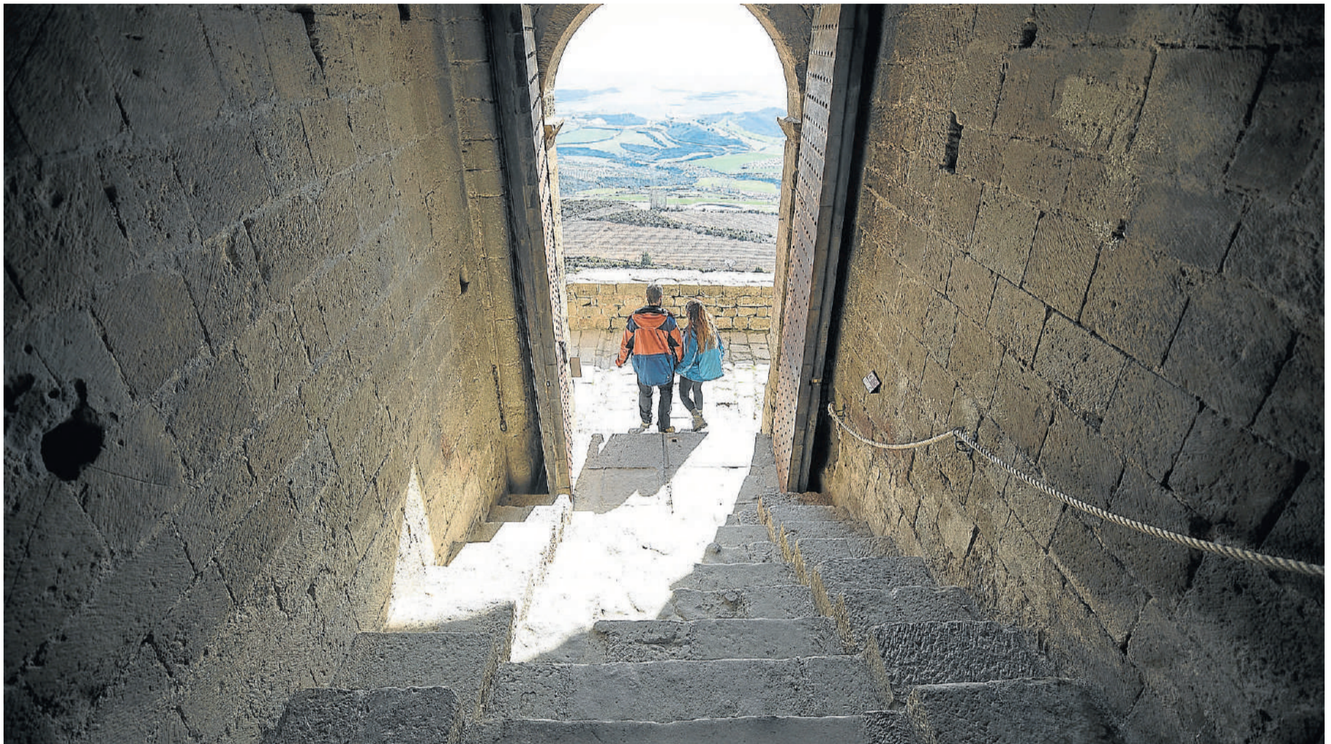
El castillo de Loarre es una de las construcciones románicas mejor conservadas en todo el mundo. LAURA URANGA