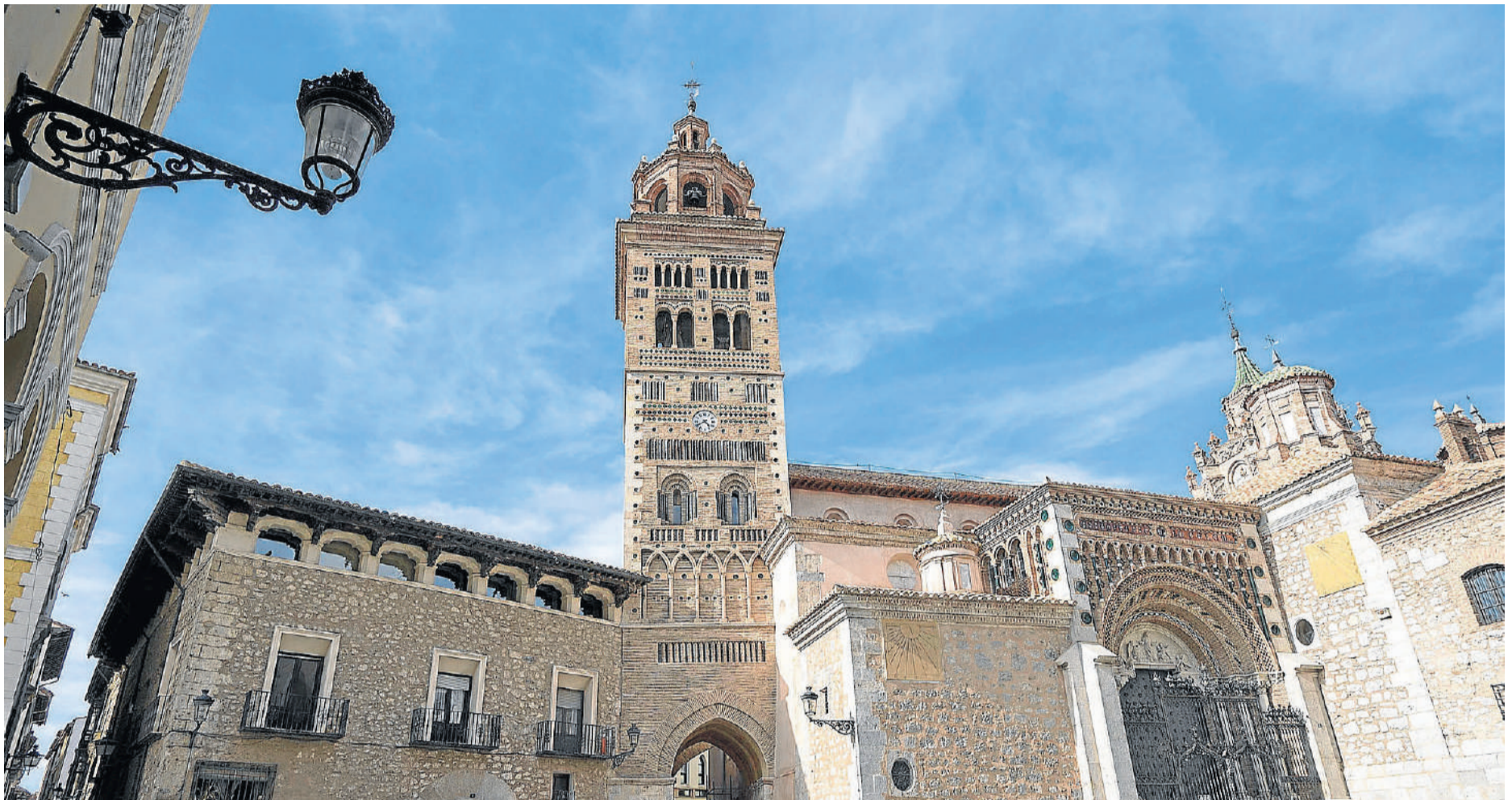
La catedral de Santa María de Mediavilla de Teruel es una de las construcciones más características del mudéjar en España. ANTONIO GARCÍA