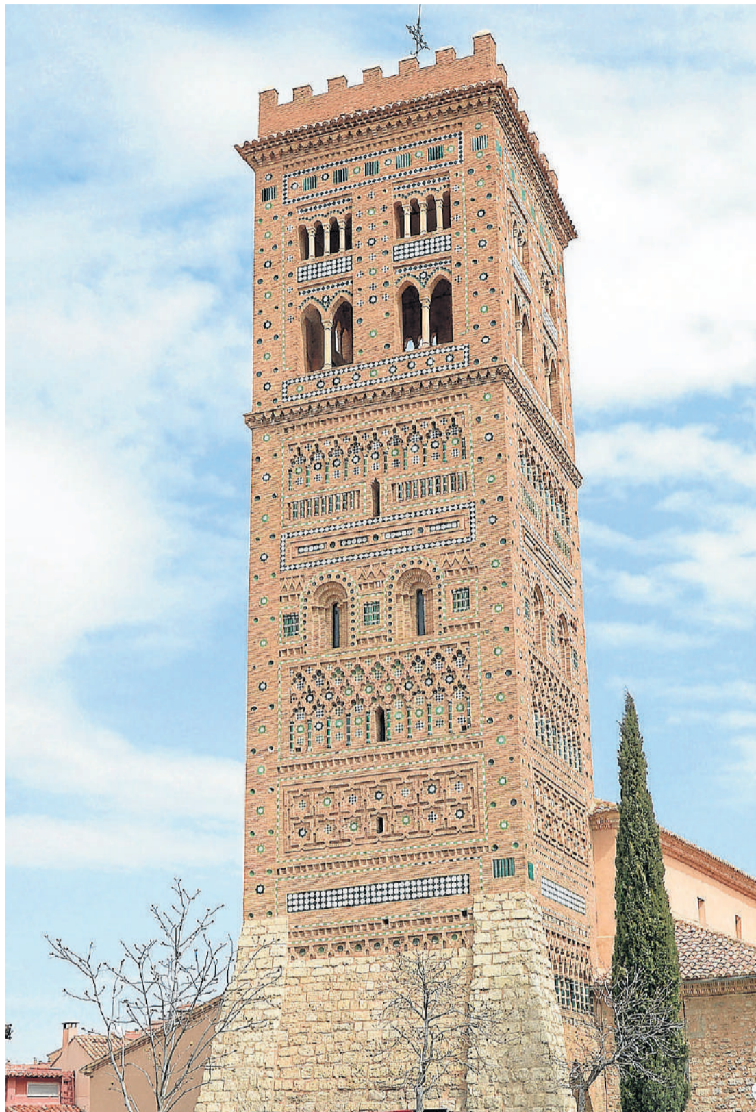
La torre de San Martín es uno de los mejores ejemplos del mudéjar aragonés, declarado Patrimonio de la Humanidad por la Unesco.

De su interior destaca el claustro, que constituye uno de los escasos ejemplos de espacios