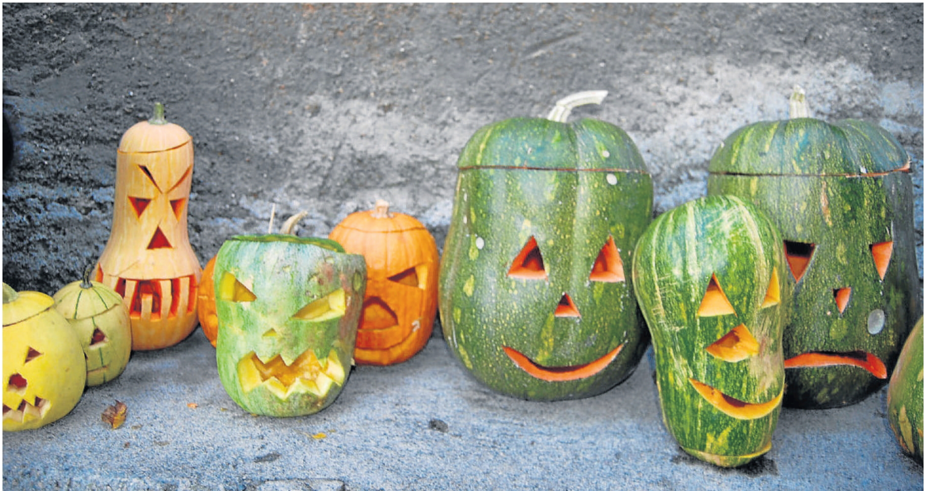
Calabazas talladas por los vecinos de Radiquero en la noche de las ánimas.