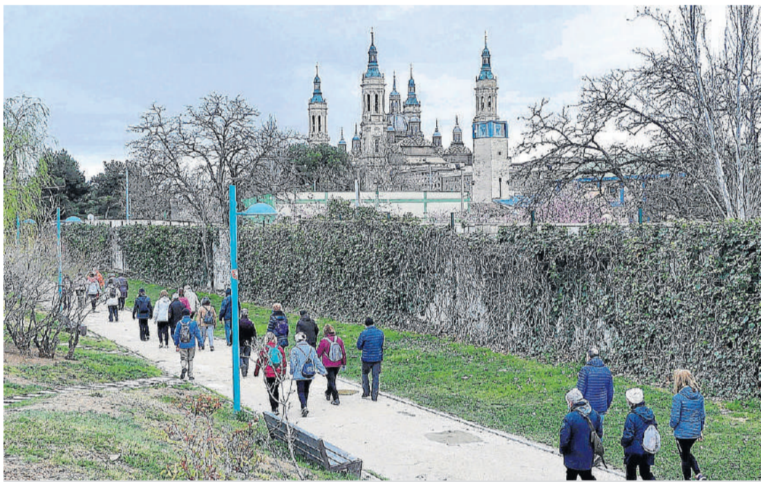
Las rutas 'Quedadas activas' están abiertas a todos los interesados solo con presentarse en los puntos de salida.

El programa 'Quedadas activas' ofrece hasta abril tres rutas gratuitas semanales a pie por Zaragoza para promocionar la salud y las relaciones entre personas de más de 55 años