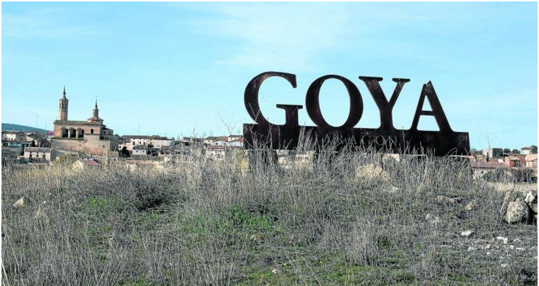
Vista de Fuendetodos, el pueblo natal de Goya, uno de los artistas aragoneses más universales. OLIVER DUCH