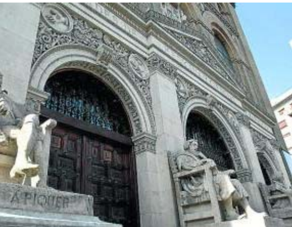
Arriba, cúpula Regina Martyrum de la Basílica de El Pilar, en Zaragoza, con frescos de Francisco de Goya. Abajo, entrada a la antigua facultad de Medicina de Zaragoza.