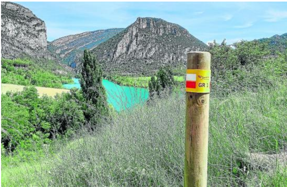
El tramo del GR 1 adecuado como Sendero Turístico de Aragón discurre por importantes monumentos románicos y parajes naturales como el congosto del Entremón.

La DPH y la FAM han continuado los trabajos de adecuación del GR 1 Sendero Histórico con el tramo de Troncedo a Paúles de Sarsa