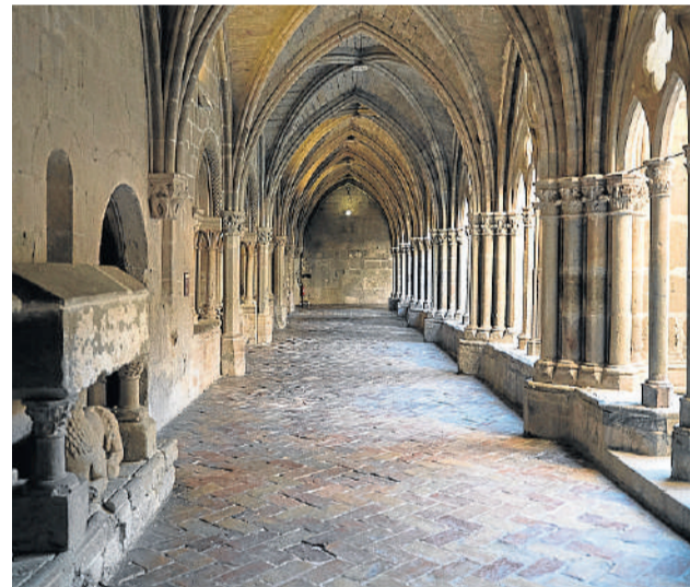
Sobre estas líneas, puesta de sol en otoño sobre los viñedos del Campo de Cariñena, ala izquierda, cascada en el Monasterio de Piedra e interior del Monasterio de Veruela.

TOMA NOTA Rutas para unas vacaciones 'slow' Romanticismo y aventura son los principales ingredientes del 'slowdriving', una iniciativa de Turismo de Aragón, que consiste en recorrer la Comunidad con calma y parando donde se desee. De las 16 rutas que se incluyen en la web slowdrivingaragon.com, dos se enmarcan en la provincia de Zaragoza: la del Corazón del Moncayo y la Ruta del Ebro, Goya y vestigios de la guerra.