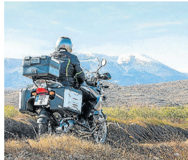
Sobre estas líneas, balneario de Paracuellos de Jiloca, en la Comunidad de Calatayud. A la izquierda, habitación en la hospedería del Monasterio de Rueda, en Sástago, y paisaje del Moncayo nevado.