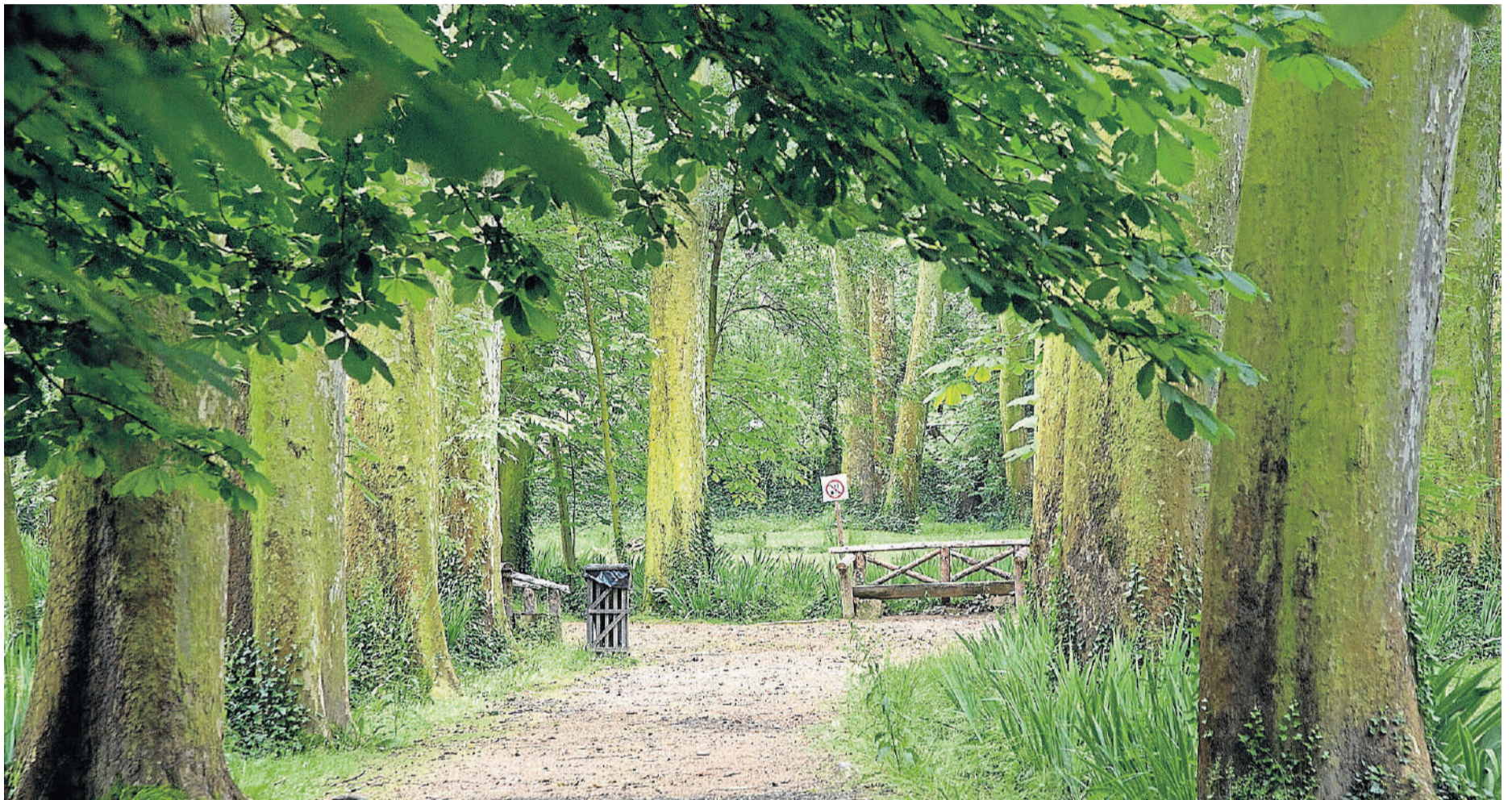
Paraje natural en torno al Monasterio de Piedra, en Núevalos, uno de los enclaves turísticos más visitados de Aragón.