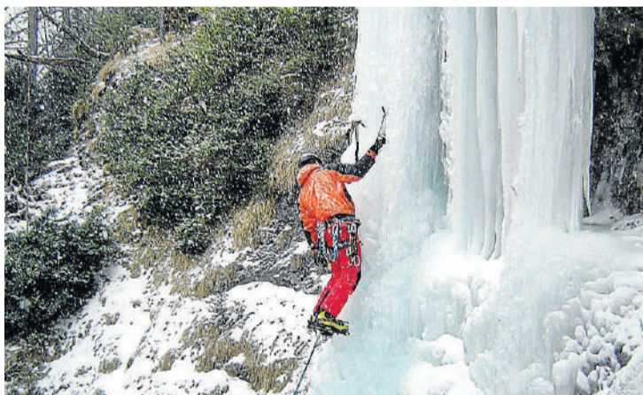
En el entorno del refugio de Pineta se puede escoger entre más de 30 vías de escalada en hielo, de niveles desde iniciación a experto.

der a las alturas de las Tres Marías o Punta Verde. En la web del refugio, valpineta.eu , se presentan todas las fichas.