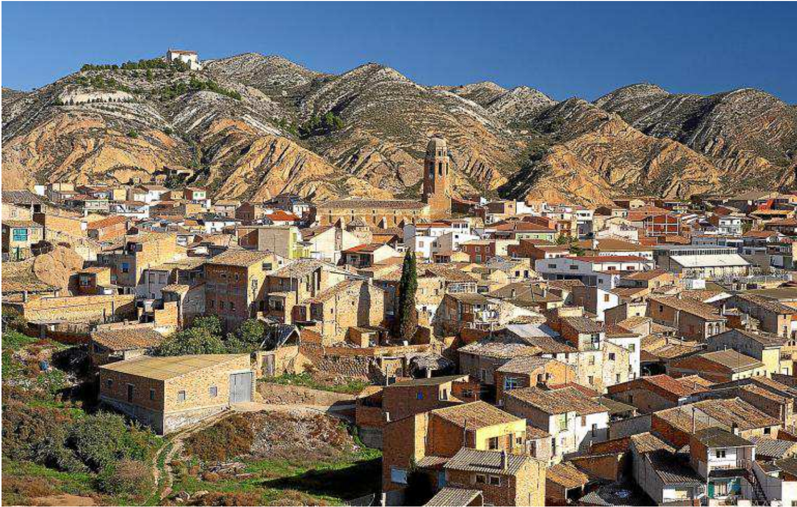
Panorámica de la localidad de Albelda, la meta de la ruta senderista que hoy se propone.