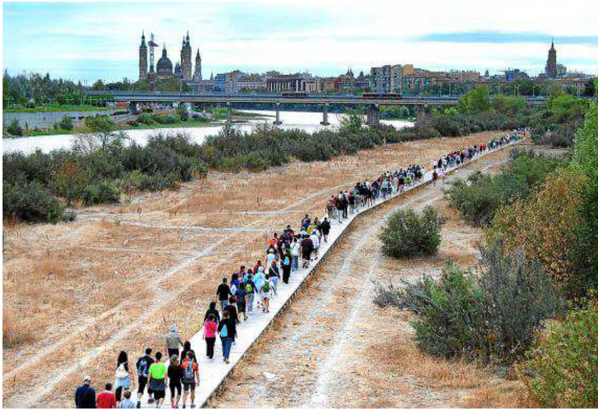
Desarrollo de la andada Memorial Labordeta a orillas del Ebro. RAFAEL CORED PENILLA