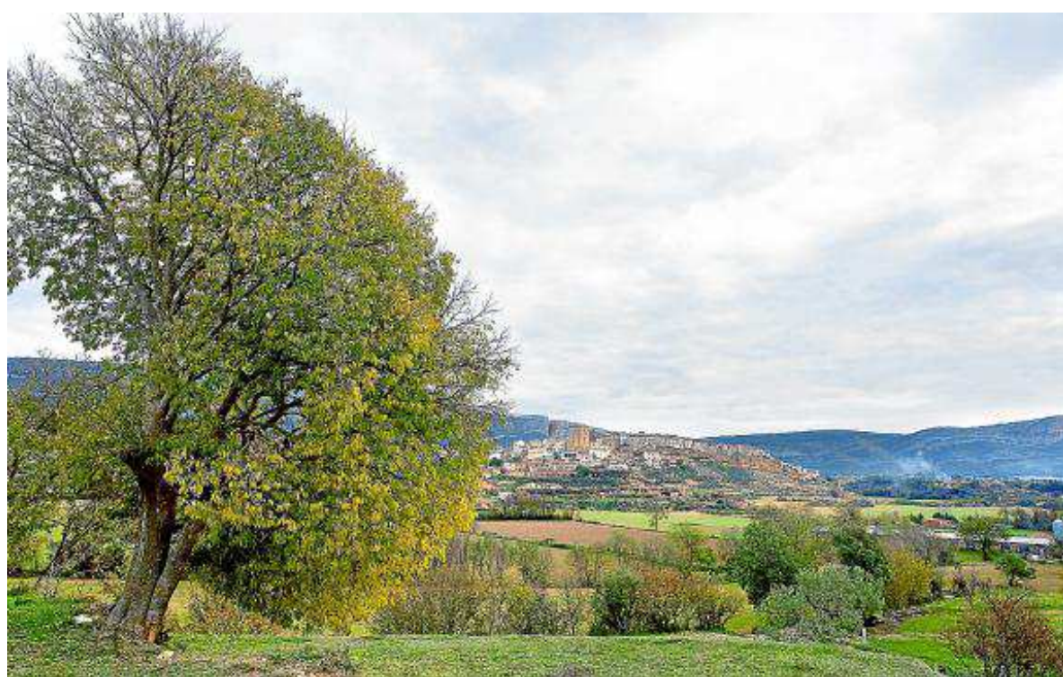
Vistas de Baldellou y su entorno.